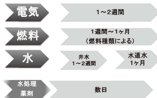
図1 災害時のインフラ復旧（イメージ）

災害で停止したボイラーを使用する場合に必要なインフラがどのように復旧するかの一例を時系列で示したものを図1に示します。